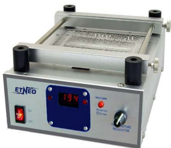
MODELLO ETR 2T

Modello ETIR 1 - CARATTERISTICHE TECNICHE : Potenza 500W - Area Utile di pre-riscaldamento 140 x 140 mm - Temperatura 50 - 400°C Controllo PID con Display - Appoggia mani in materiale isolante - Dimensioni totale L320 x P220 x A70 mm - Riscaldamento rapido - Griglia asportabile - Costruito a norme CE